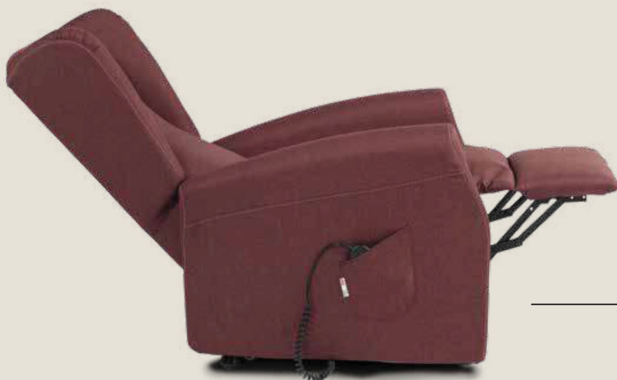
POLTRONA TRILLY CON TIPOLOGIA BRACCIOLO 2