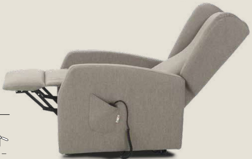
POLTRONA TRILLY CON TIPOLOGIA BRACCIOLO 3