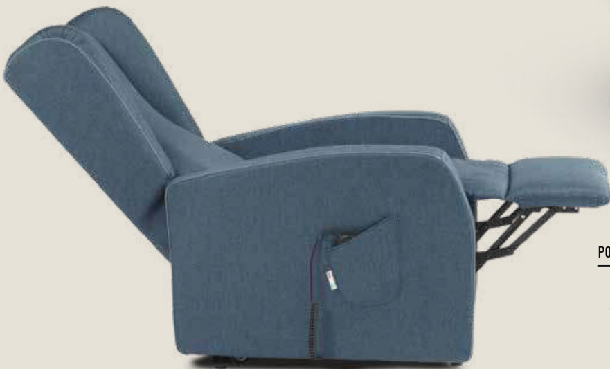
POLTRONA TRILLY CON TIPOLOGIA BRACCIOLO 1